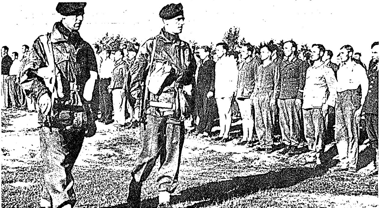
En må gå nøye til verks, det tar lang tid, og imens står tyskerne i «Giv akt» mens allierte soldater Inspiserer rekkene. Ved utplukkingen hadde en god assistanse av norskfødte quislinger, som nå var like ivrige til å angi sine tidligere herrer som de før var til å angi gode nordmenn for å komme i godt lys hos herrefolkets representanter.