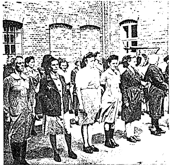
Og her har vi lyske gråmus på linje. Den militære holdning er noe slapp. Men så er de også misfenkl for å skjule krigsforbrytore i sitt hospital, innimellom de ordinære soldater. Det er jo en uheret beskyldning, de som alle ville det så vel og selv ikke har gjort noe gall!

s n e n er t. je få ar og en lig est- and