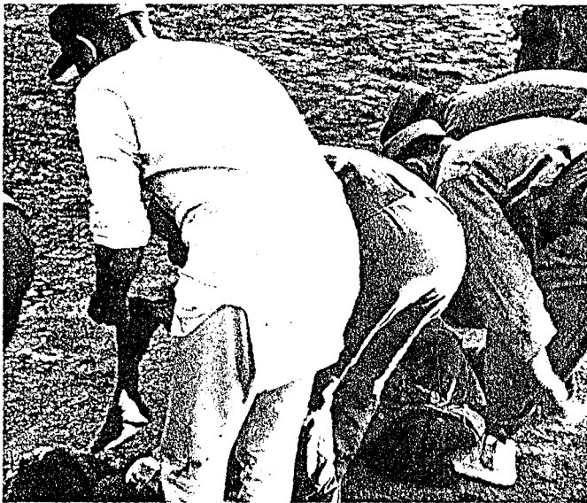
En utveg var det å ta klærne med og iføre seg den fordums stolte uniform på linjen.