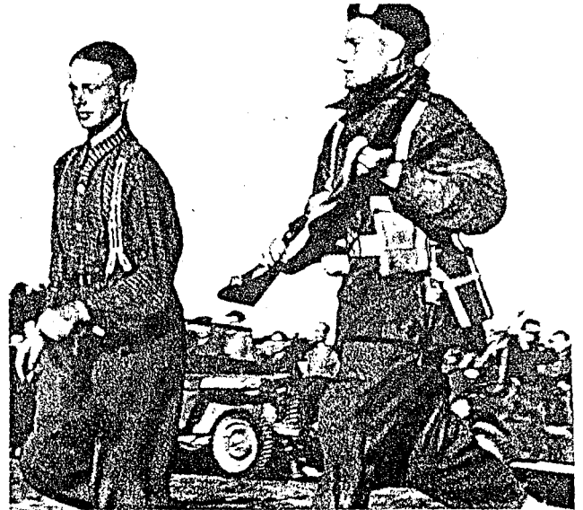
Og gikk det ikke fort nok, så var det råd med det. Skjønt tyskerne nå er vant til å ha de allierte i hælene, så går det an å lå fart på dem ennå.