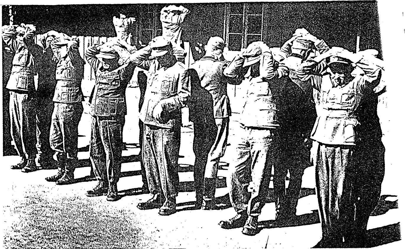
Og her har vi en del av jaktutbyttet. De liker seg ikke nå, og vi kan innrømme at stillingen er mindre behvem når minuttene går langsomt og blir til timer. Men det er kæreren uten samvittighet og følelse for medynk, de kan være glad de blir behandlet korrekt.