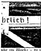
«Nichte infflocht» - ro i

752 norske jøder ble tilintetgjort. 25 kom tilbake.