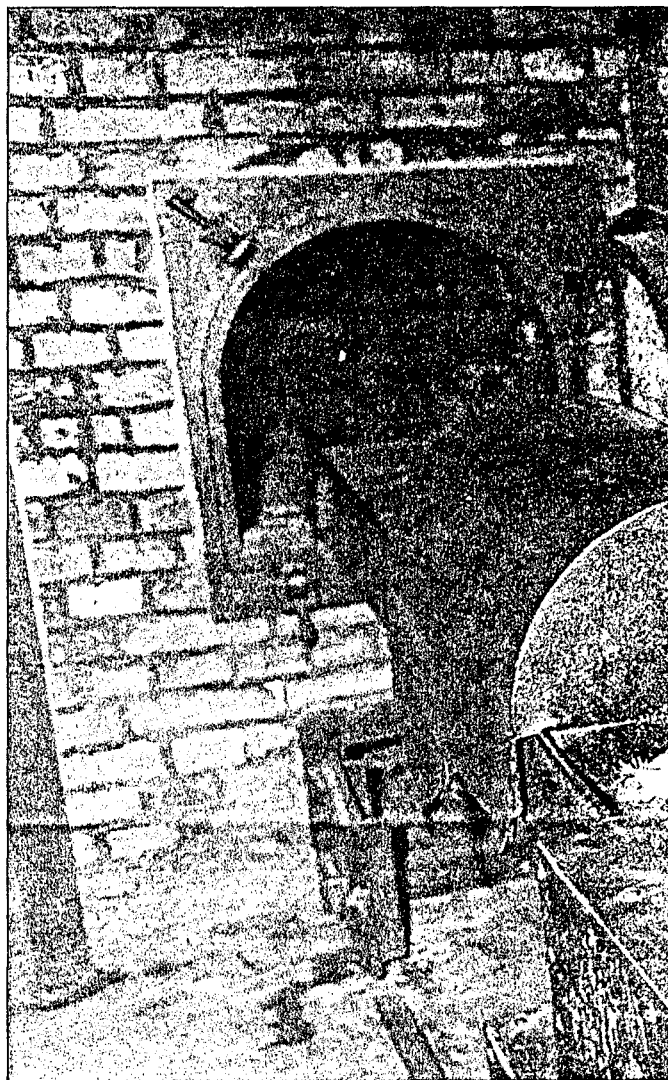
KREMATORIET: Her satte tyskerne masse-mord i system. Krematorieovnene ble år. Flesteparten ble gasset rett etter ankomst – blant andre hans mor.

I et offisielt SS-dokument som ble funnet