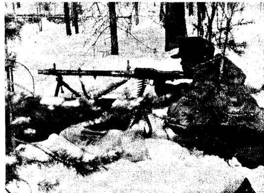
Norsk skjeger i Karelen. I såkalt «lurestilling» med MG 34 (Maschienengewehr 1934). Det var på alle måter en tøff opplevelse særlig når gradestokken sank mot førti grader.

riksarkivet, Hjemmefrontmuseet i Oslo, det tyske militærarkiv i Freiburg, krigsarkivet i Helsingfors og ved det russiske vitenskapsakademiet i Petrosavodsk. A.J.