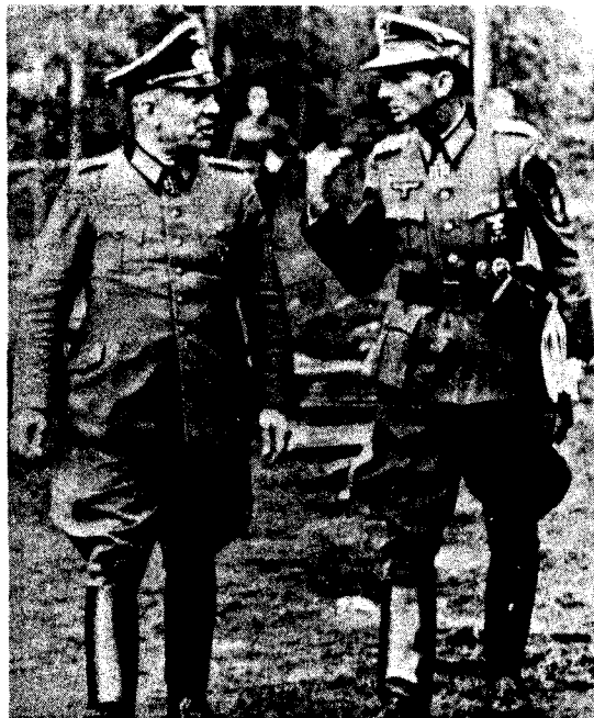
Den tyske øverstkommanderende i Norge, generaloberst Nikolas von Falkenhorst (i.v.) var også i innledningsfasen øverste leder for de tyske styrker i Finland. Her sammen med «shelten fra Narvik» general Dietl, sjef for Gebirgsgruppen, som de norske skjegerne var underlagt.