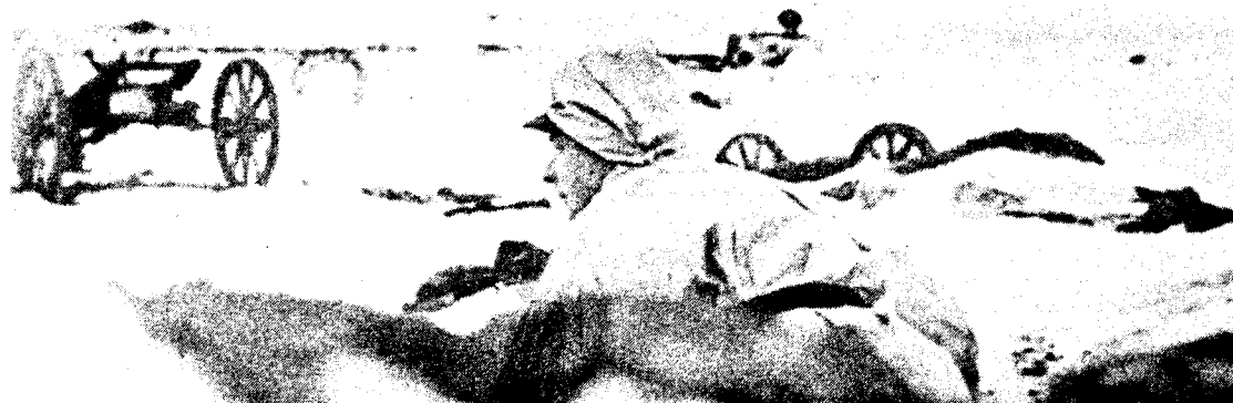
En ekstrem kulde gjorde den grusomme krig på Østfronten enda grusommere.