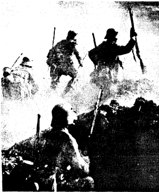
I krigens første fase var de norske legionærer på offensiven sammen med de tyske og finske tropper. Siden ble det annerledes.