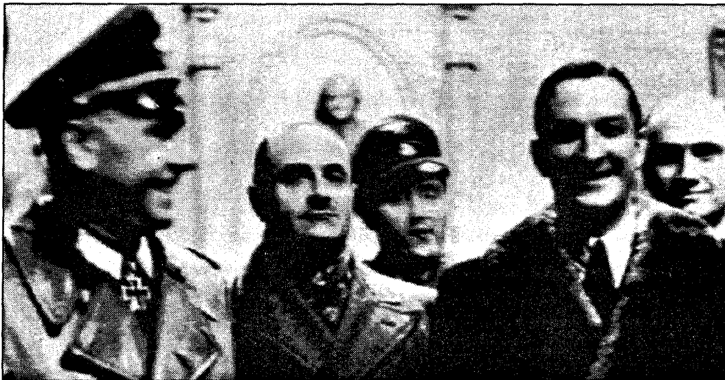
UNDER KRIGEN: En pelskledd politisjef (foran t.h.), René Bousquet, sammen med tyske nazioffiserer i januar 1943. I går ble han skutt ned og drept i Paris, like før han skulle stilles for retten igjen.