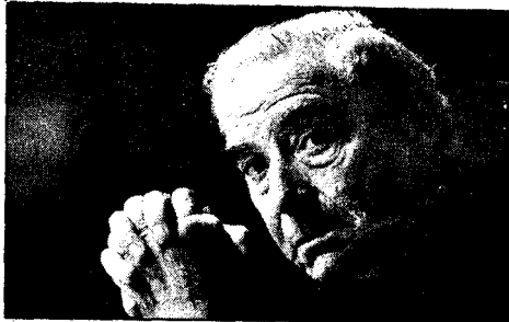
STOPPET BAUTA: Stortingpresident Jo Benkow fikk satt en stopper for forsøket på å reise en bauta over norske frontkjemper som falt i Finland under siste krig.

Bisetelse i Nordstrand kirke Torsdag 8. juli Kl. 14.30