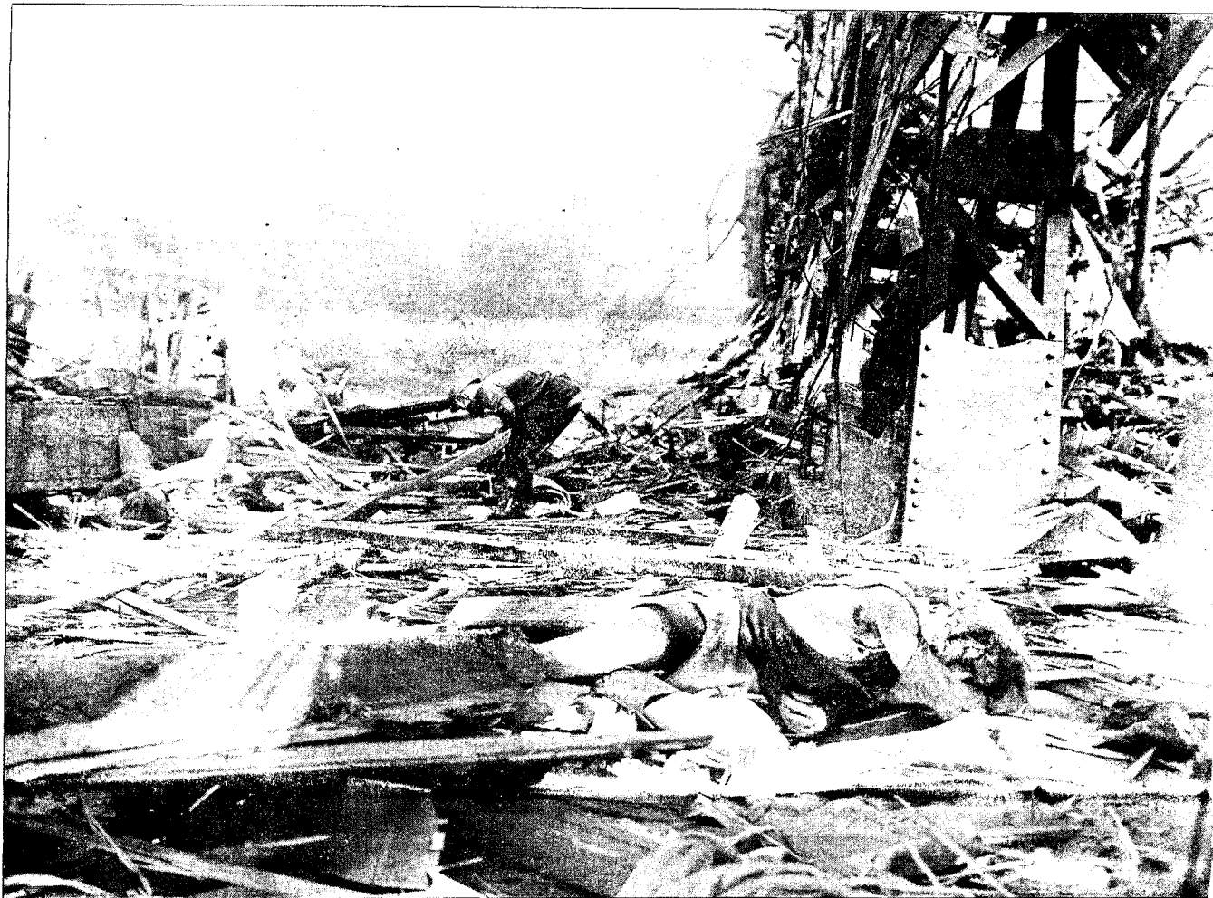
DRAMATISK: Døde og sårede lå spredt utover Grønlikaia etter eksplosjonen i august 1945.