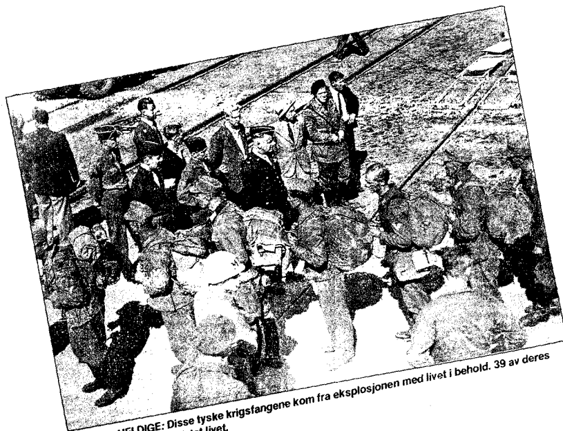
HELDIGE: Disse tyske krigsfangene kom fra eksplosjonen med livet i behold. 39 av deres kamerater mistet livet.