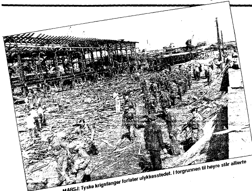
MARSJ: Tyske krigsfanger forlater ulykkesstedet. I forgrunnen til høyre står allierte offiserer.