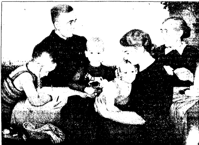
FAMILIEPORTRETT: Er dette et eksempel på tidens gjengse tradisjonsbundne kunst eller er det ideologisk nazikunst? Legg merke til farsfigurens uniformslignende antrekk.

De siste årene har det blåst en revurderings vind over den annen verdenskrigs tapere.