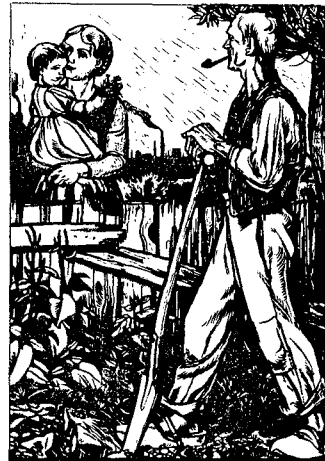
Et innblikk i det nazistiske gjenferdige

Peter Adams: «Arts of the Third Reich», New York 1992 Harry N. Abrams