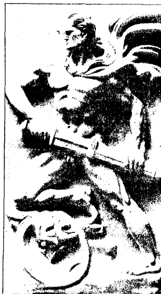
LIVVAKTEN: Et relieff i klassisk stil av Arno Breker.

Kunsten spilte en stor rolle i nazistenes arbeid med å bygge opp tusenårsriket. Gjennom spektakulære kunstmønstringer ble den godtatte kunsten vist frem i storslåtte, spesialbygde praktanlegg, og ved flere anledninger vist i kontrast til den «degenererte» modernistiske kunsten. Hitler var en stor beundrer av 1800-tallets kunst, det vi i dag betegner som salongmaleriet og realismen. Dette var en type kunst med stor latent appell i folket, og den hadde store muligheter for lettfattelige, slående budskap. Den passet derfor som hånd i hanske for nazistene i deres arbeid med å skape «det nye mennesket». Kunsten ble i teorien uløselig koblet med politikken og ideologien. Dette var uforenlig med modernismens frihetsideal. Max Liebermanns skjebne illustrerer dette skillet godt. Kort tid etter at Hitler kom til makten, gikk Liebermann av som president for akademiet i Berlin med følgende ord: «Det er min overbevisning at kunst ikke har noe med politikk eller opprinnelse å gjøre. Siden denne min overbevisning ikke lenger er gyldig, kan jeg ikke lenger tilhøre Det Preussiske Akademi, hvor jeg har vært medlem i over trediva år...» Dagen etter led makthavernes svar: «Liebermanns forestilling om den isolerte kunstner, adskilt fra Das Volkstum, har mistet sin gyldighet i dag og i fremtiden.» Mens modernistene ble