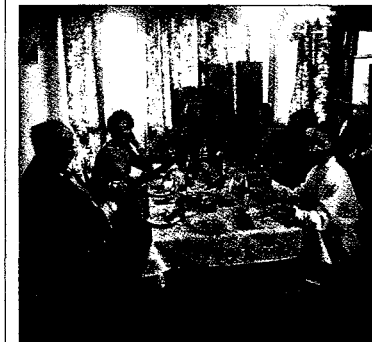
I selskap med meget hyggelige russerne.

så stygt i årtusner, med en liten klatt av frihet mellom 1918 og 1939. ■