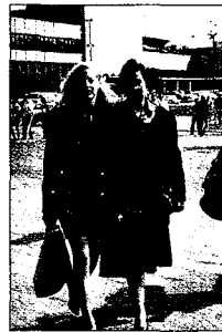
Moderne frakker på byen

Neste stopp – Tallin med sin sjarmende «gamleby» og en enorm biltrafikk som det ikke fantes for to år siden. Gamle bilvrak vil jeg kalle det – for forbi en man kunne bli