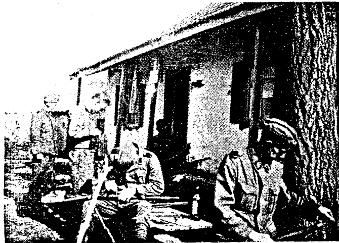
Regiment Nordland med våpenpuss ved Dnjeprputovsk. En av soldatene på bildet er fra Halden.

I januar 1941 kom oppropet til norsk ungdom fra Quising. Vær