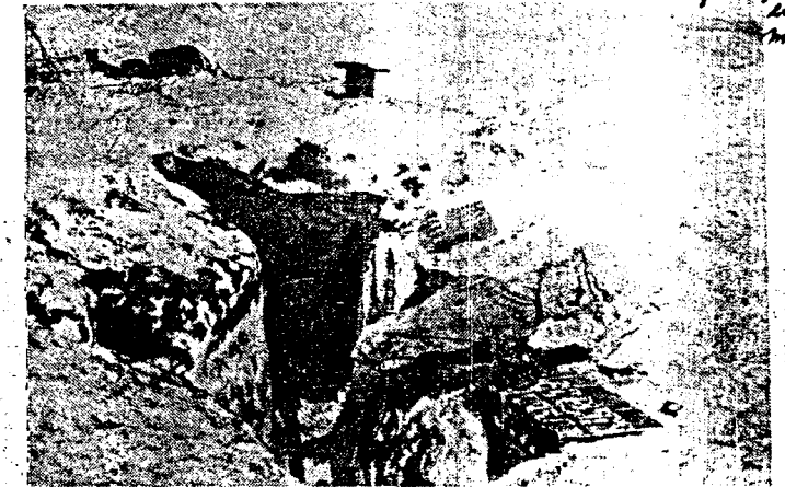
I tjuetretti graders kulde var krig på Østfronten et iskaldt helvete, om en kan bruke et slikt uttrykk. Her har B. måttet pakke inn sitt maskingevær til beskyttelse mot frosten. I bakgrunnen en sekk som markerer inngangen til bunkeren. Bildet er fra Mius-fronten. - Bildene som er vist her er utlånt fra en haldenser som var med.