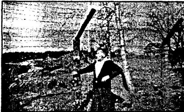
Etter krigen var det NS-medlemmene som kom bak piggråd. Dette er en av B.s kamerater fra Halden. Bildet er sannsynligvis fra fangeleiren på Bjørkelangen.

Han ser på oss. Tar noen drag av sigaretten.