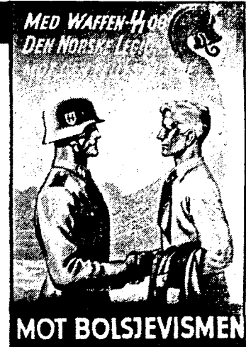
Propagandaplakat fra krigens år. Bildet taler for seg selv.

– Men si oss, B., hvorfor meldte du deg inn i Nasjonal Samling?