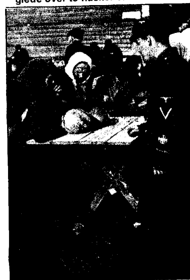
Dette er glimt fra de norske Waf-fen-SS-soldatenes virkelighet ved Leningradfronten. Kuplene på bygningen avslører at man befinner seg i Russland. Kålholder til salg for en norsk Kriegsberichter – krigskorrespondent – og til venstre: Germansk frontglede over to flasker vin...

NASJONAL RIKSFLETT Billed- og PROPAGANDA