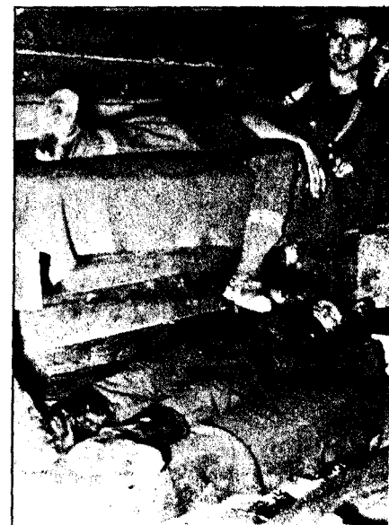
Den unge nordmannen fra Legion Norwegen står 47 km fra Leningrad, eller Petersburg. Til høyre: Frivakt i en tømmerbunker ved fronten...ingen luksustilværelse.

vi nordmenn, da. Oss imellom kunne vi til og med holde ap med tyskere: Han må ikke jekke seg opp, den skrupp-ariere, kunne vi si.