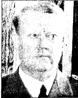
KONTAKTEN: Vidkun Quislings brev tyder på at en tettere forbindelse mellom Quisling og Kristen Samling enn man hittil har vært klar over.