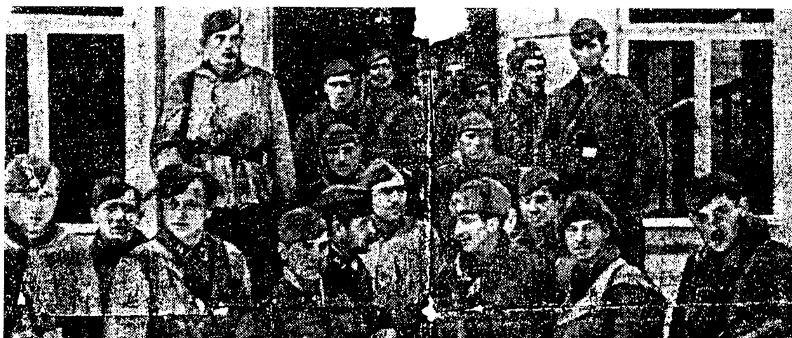
Einsender: Fritz Weiher

während dieser Zeit. Nach kurzen Stunden der Ruhe auf schnell aufgeworfenen Lagern aus Tannenreisig marschierten sie Tag für Tag mit vollständig durchnässten Kleidern, mit halberfrorenen Füßen nach Westen, immer wieder in der Spannung, entdeckt zu werden. Denn in jedem Dorf lauerte der Feind. Noch stehen ihnen die Spuren der durchlebten harten Wochen im Gesicht geschrieben. Lazarett und Urlaub werden ihre Wunden bald heilen und wieder voll eingesetzt, werden die 25, die aus allen deutschen Gauen und den nördlichen Ländern stammen, den Bolschewisten zeigen, daß ihr Siegeswille und ihre Kampfkraft, die sie alle das Furchtbare überstehen ließen, ungebrochen ist.