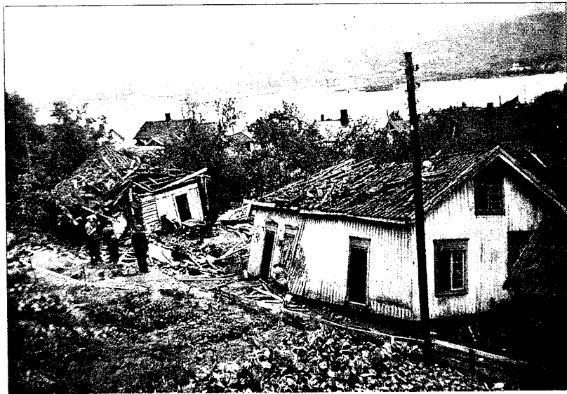
MANGE HUS ØDELAGT. I alt ble 18 hus ødelagt under bombingene. Her ser vi litt av dette. I Knardalstrand ble ei lita jente drept da ei bombe traff helt feil mål og falt ned i huset.