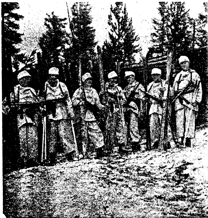
Spähtropp klar til utrykning

«Fra sine godt gjemte bunkerstillinger foretar nordmennene det ene speidertokt etter det andre. De har fått en spesialoppgave disse karene takket være sin skiløperferdighet: nemlig å sikre tyske lytte-