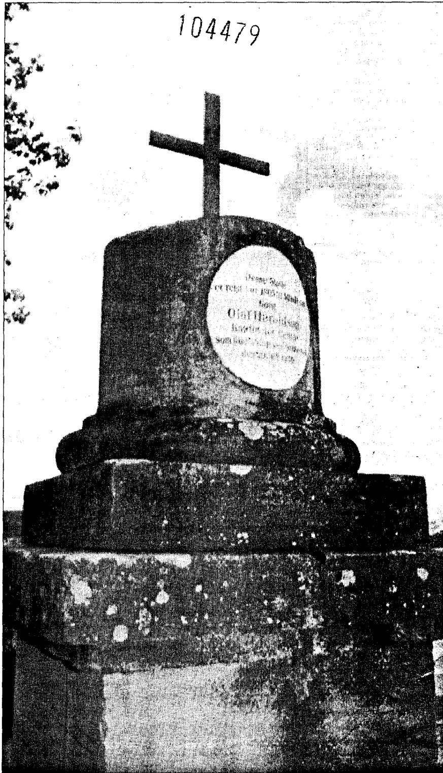
BESKJEDENT: Et enkelt, beskjedent monument over en av de viktigste begivenhetene i norsk historie – slik har Stiklestadmonumentet med et kort avbrudd under kirgen stått i nærmere 200 år.

– I denne sak er jeg verken nordmann eller tysker, men germaner, kunnngjorde en tysk SS-oberst som ble brakt inn i striden som oppsto da de norske nazi-myndighetene rev støtten fra 1805 og laget sitt eget, mer storslåtte og germanske minnesmerke på stedet – som det for øvrig slett ikke er noe