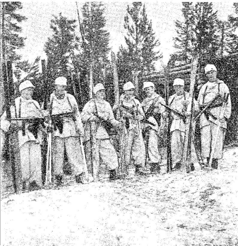
Spähtropp klar til utrykning

«Fra sine godt gjemte bunkerstillinger foretar nordmennene det ene speidertokt etter det andre. De har fått en spesialoppgave disse karene takket være sin skiløperferdighet: nemlig å sikre tyske lytte-