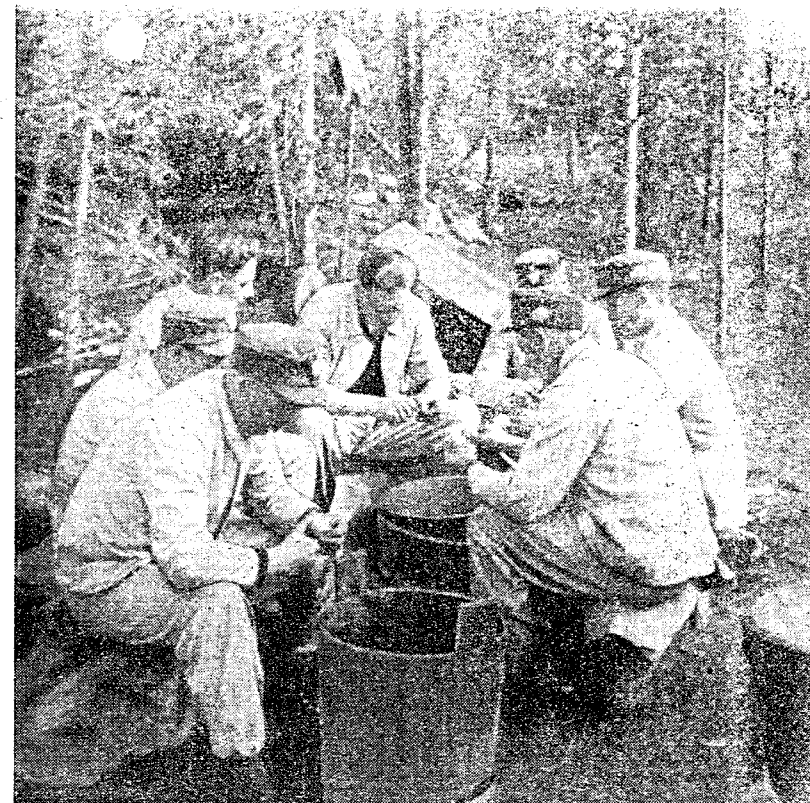
I hvile- stilling

poster som ligger framskutt mellom bolsjevikiske støttepunkter i den uoversiktlige urskog, rense opp for fiendtlige speidertropper og grupper, sikre de tyske frammarsjveger og ødelegge fiendtlige forsyningskolonner.