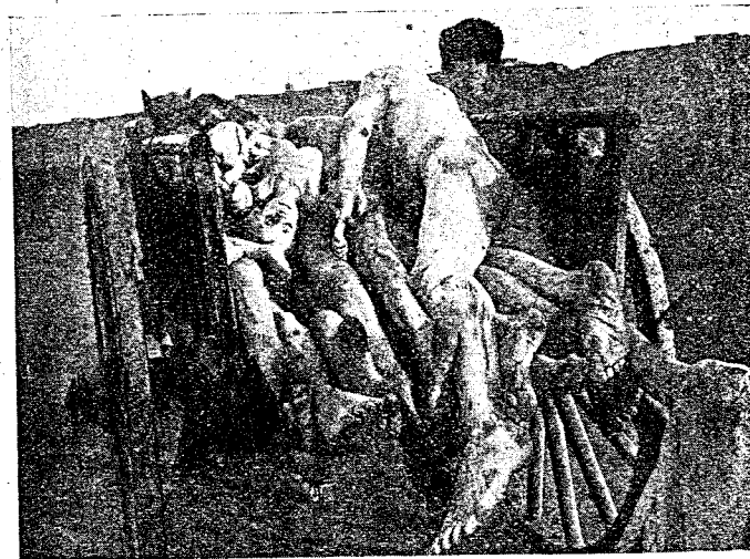
Marxismen i praksis.

Statsminister Nygårdsvold uttalte også i sin valgtale i Kringkastingen lørdag den 3. oktober i år, at partiets mål er å innføre marxismen i Norge.