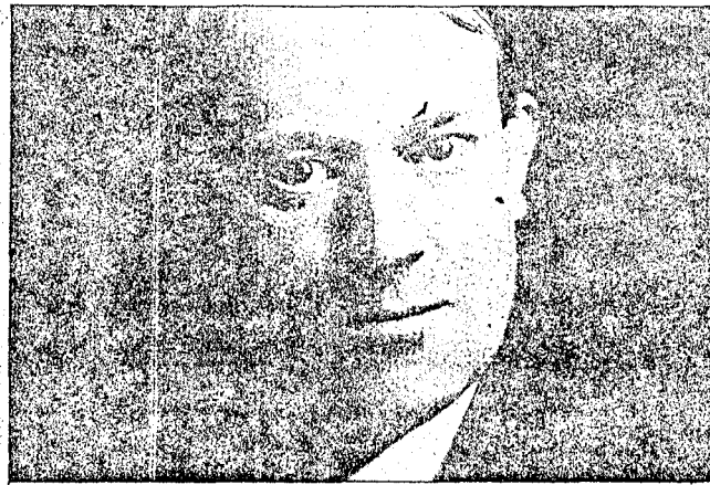
Det er historikerens oppgave å forsøke å frigjøre seg fra samtidens egne vurderinger, særlig når man skal skille fakta fra fiksjon i et tema som Quisling. Bildet av Quisling er hentet fra forsida av Hans Fredrik Dahls bok.

Foranledningen var nettopp den irritasjon Jens Hundseid hadde vakt med kriseforliket. Lagsformennene merket hvor vinden blåste i hjembygdene sine: «Den gikk ikke i deres egen