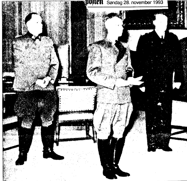
AKTØRER: Uten å innhente tillatelse fra Berlin, men i samråd med Quisling, bestemte Terboven seg for å gjøre opp med «de fordømte intellektuelle». Gestaposjefen Wilhelm Rediess (t.v.) holdt tale på Universitetsplassen 30. november på Terbovens vegne. Han sa blant annet at de norske studenter skulle omskoleres til rett-troende nazister i en spesiell leir i Tyskland.

BLIX: «Julehilsen til Hitler» kalte Blix (Stig Höök) denne tegningen som han fikk trykt i Göteborgs Handels- och Sjöfarts-Tidning i de dager norske studenter ble arrestert. Det er Terboven som snakker til Quisling: – Si det med blomsten av Norges ungdom, herr Quisling!