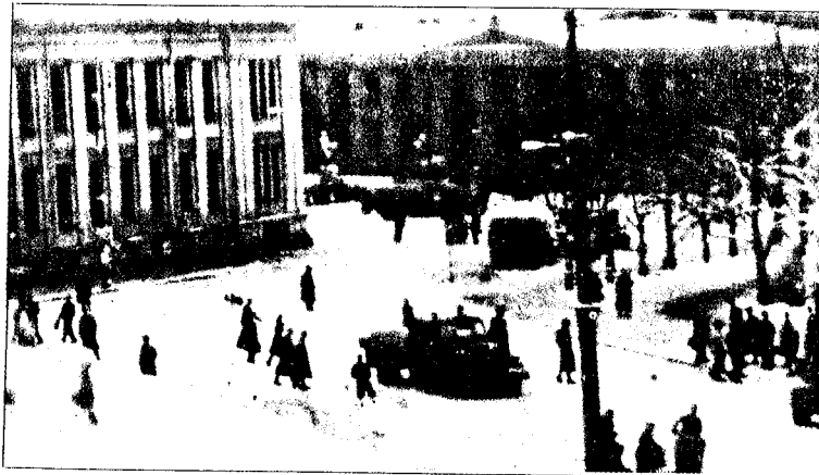
TYSK AKSJON: Tysk politi og militæravdelinger omringer Universitetet og begynner sin jakt på de norske studentene den mørke novemberdagen for 50 år siden. Gestapos biler ses bl.a. på Universitetsplassen. Flere av deres folk opptrådte i sivilt antrekk. Dette bildet havnet ad forskjellige omveier i London, og i bildeeksten som hører til fra den gang, heter det at det ble utvist stor brutalitet mot de mennesker som tilfeldigvis befant seg innenfor det avsperrede område.