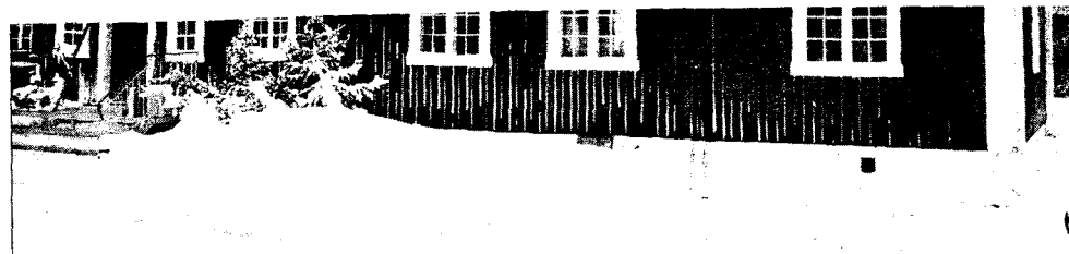
TILHOLDSSTED: På gården Nordmo i Målselv, holdt den norske overkommando under general Otto Ruge til i mai og juni 1940.