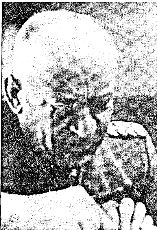
General Nicolaus von Falkenhorst planla og ledet det tyske angrepet på Norge.