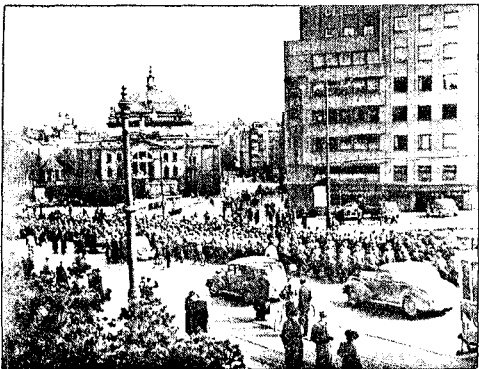
Ved 15-tiden marsjerte tyske hæravdelinger inn i en lamslått hovedstad.

Vi vet aldri om landet vårt vil oppleve ett nytt 9.april. Det vi vet er at en ny verdenskrig sannsynligvis vil ødelegge vår klode og hele menneskeheten for godt. Sett på den bakgrunn er det nyttig å trekke lærdom av det som skjedde for 50 år siden. Og vi må sette vår lit at kommende generasjoner vil prioritere fredsarbeidet fremfor rustningsindustrien.