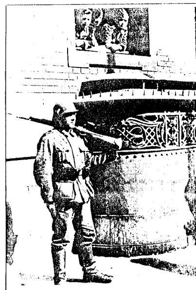
Nationaltheatret i Oslo ble etter invasjonen tatt i bruk som forelegg for tyske soldater.