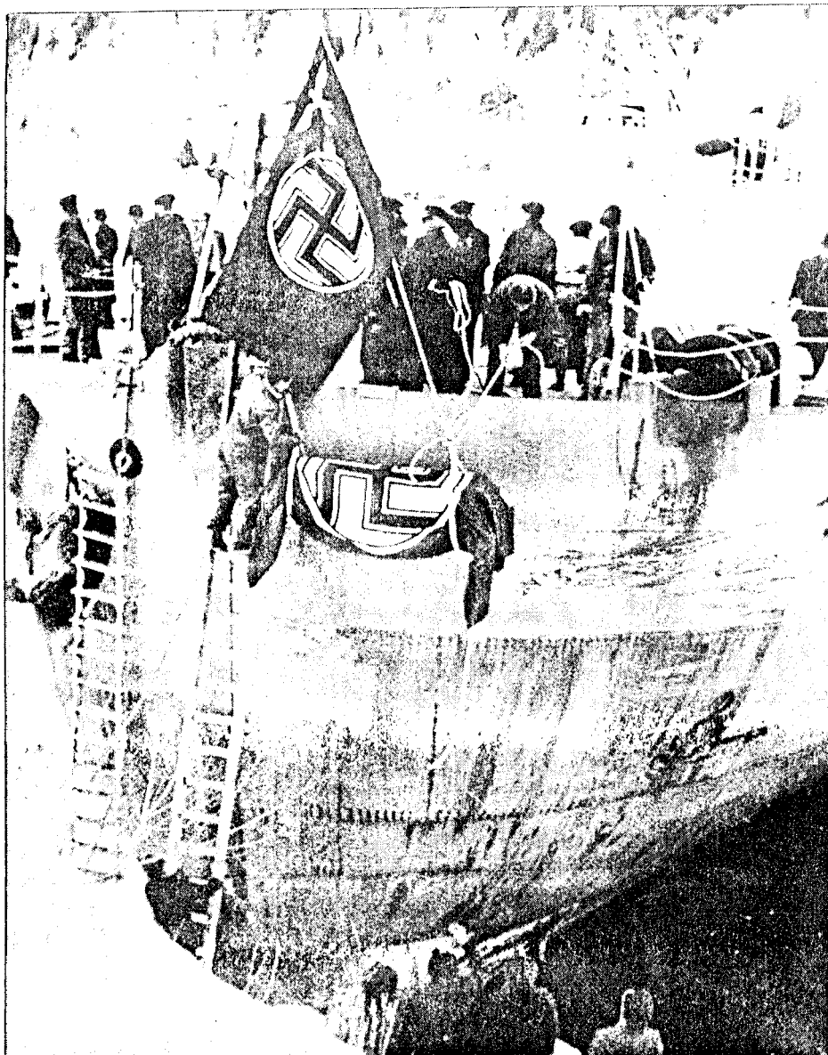
Engelskmennenes angrep på Altmark i Jøssingfjorden gjorde Adolf Hitler så rasende at han flukstens bestemte seg for å iverksette et angrep på Norge.