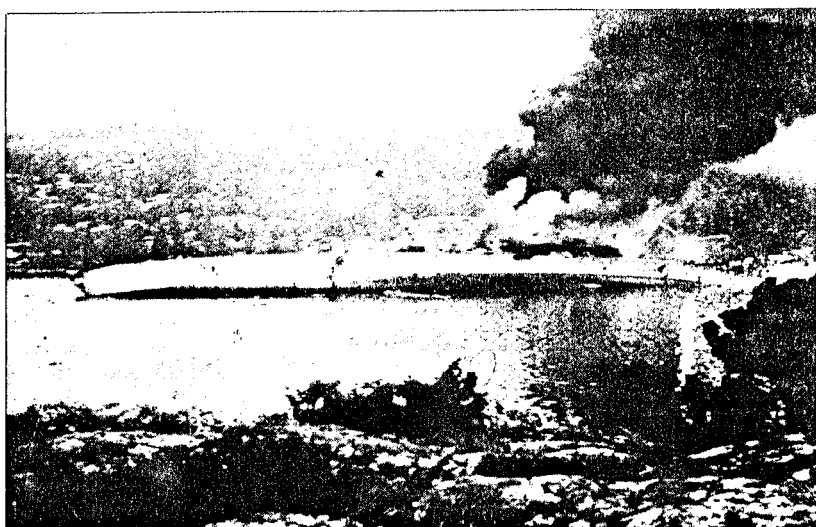
Det berømte bildet av Blücher, slagskipet som så sjokkerende for tyskerne ble senket av artilleriet på Oscarsborg i grålysningen 9. april.