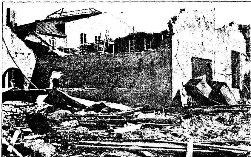
Flere hangarer og verkstedbygninger på Kjeller ble bombet om morgenen 9. april. Her fra motor- og plateverkstedet, som ble totalt ødelagt.