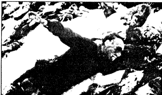
FALNE RUSSERE på Østfronten.