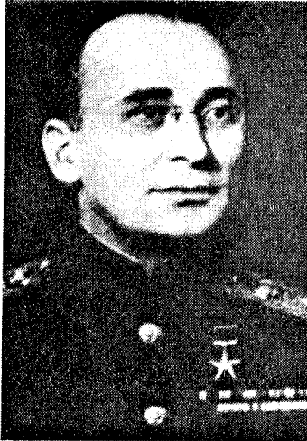
Lawrentij Berija, der bolschewistische Massenmörder. 1953 geriet er selbst in die Vernichtungsmaschinerie seines Systems und wurde in Moskau hingerichtet.

Unerschrockene deutsche wie ausländische Historiker zerrissen das Lügennetz von Katyn und wiesen auf Stalins Schuld hin. 1981 errichteten Exil-Polen in Johannesburg (Südafrika) ein Katyn-Denkmal mit der Aufschrift: „Zur Erinnerung an 14500 polnische Kriegsgefangene, die von Stalins Meuchelmördern umgebracht wurden.“ Am 22. Februar 1989 meldete die Nachrichtenagentur „Reuter“: „Die Inschrift des Warschauer Mahnmals, das an die Ermordung polnischer Offiziere in Katyn während des 2. Weltkrieges erinnert, soll nach den Worten des polnischen Regierungssprechers geändert werden. Entgegen der bisherigen offiziellen Version soll nicht länger der ‚Hitler-Faschismus‘ für den Massenmord verantwortlich gemacht werden. Sechs Tage zuvor hatte ein offizielles polnisches Presseorgan erstmals berichtet, daß der Massenmord von der sowjetischen Sicherheitspolizei NKWD und nicht von den Deutschen begangen wurde.“ Auch der Lügen-Hinweis am Mahnmal im Wald von Katyn wurde zwischenzeitlich getilgt. Dort hatte es jahrzehntelang geheißen: „Hier wurden im Herbst 1941 11000 polnische Kriegsgefangene, Soldaten und Offi-