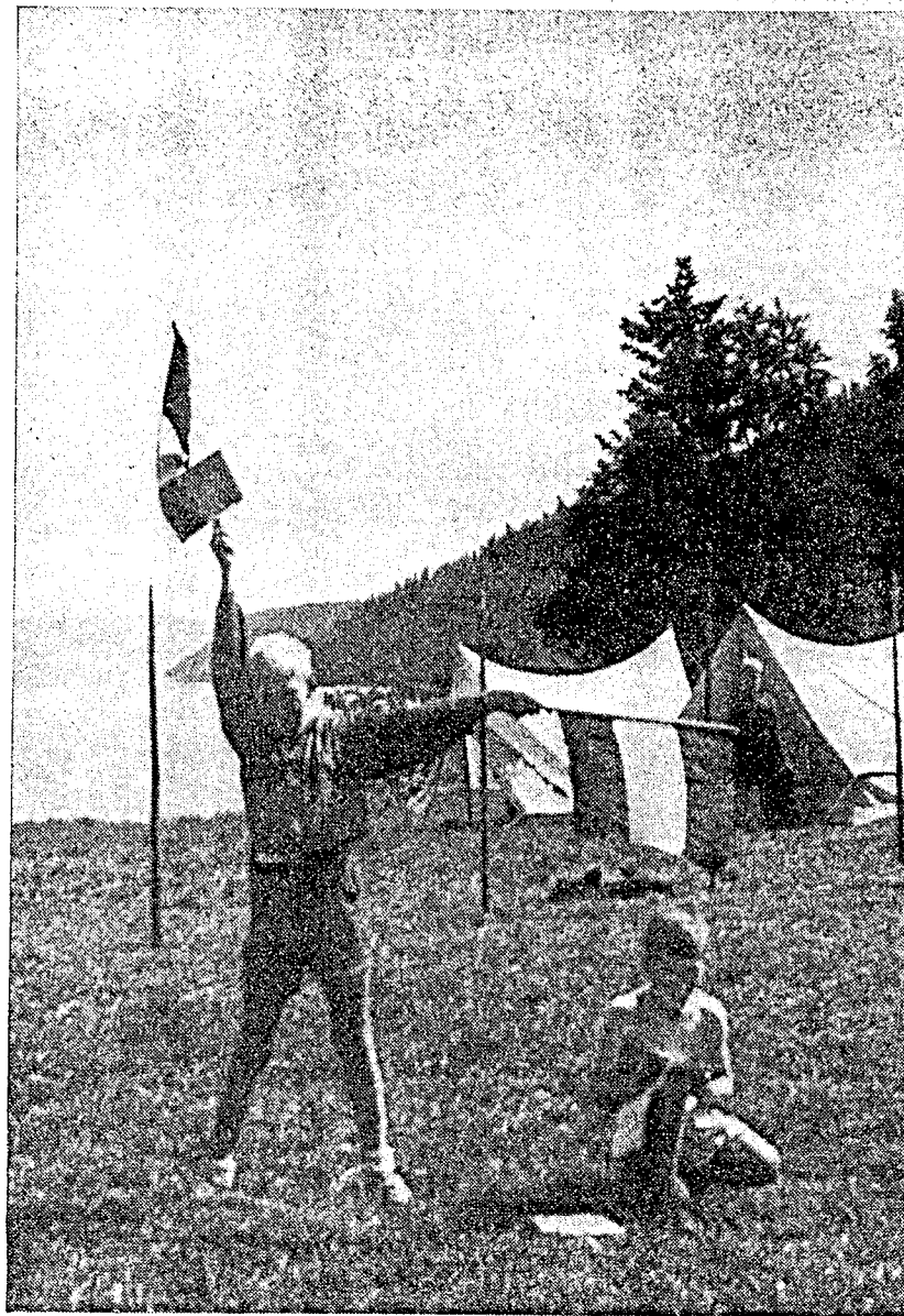
Fra livet i ungdomsfylkingen.

På bakgrunn av disse dystre forhold er det at Nasjonal Samlings Ungdomsfylking er gått til arbeid og kamp for Norges ungdom og dens framtid. Vårt prinsipp er at for Norge er bare det beste godt nok. Derfor lar vi ikke lenger ungdommen som er landets framtid, gå for lut og kaldt vann. Uten hensyn til om foreldrene er rike eller fattige, om de er skipsredere eller husmenn, om de er håndens eller åndens arbeidere vil vi gi all norsk ungdom den utdanning den har krav på og er berettiget til etter sine evner og medfødte anlegg . Det som teller i våre rekker er evnen, vilje og kraften til å kjempe og arbeide for Norges sak. Vi vil et sosialistisk Norge, hvor den enkeltes stil-