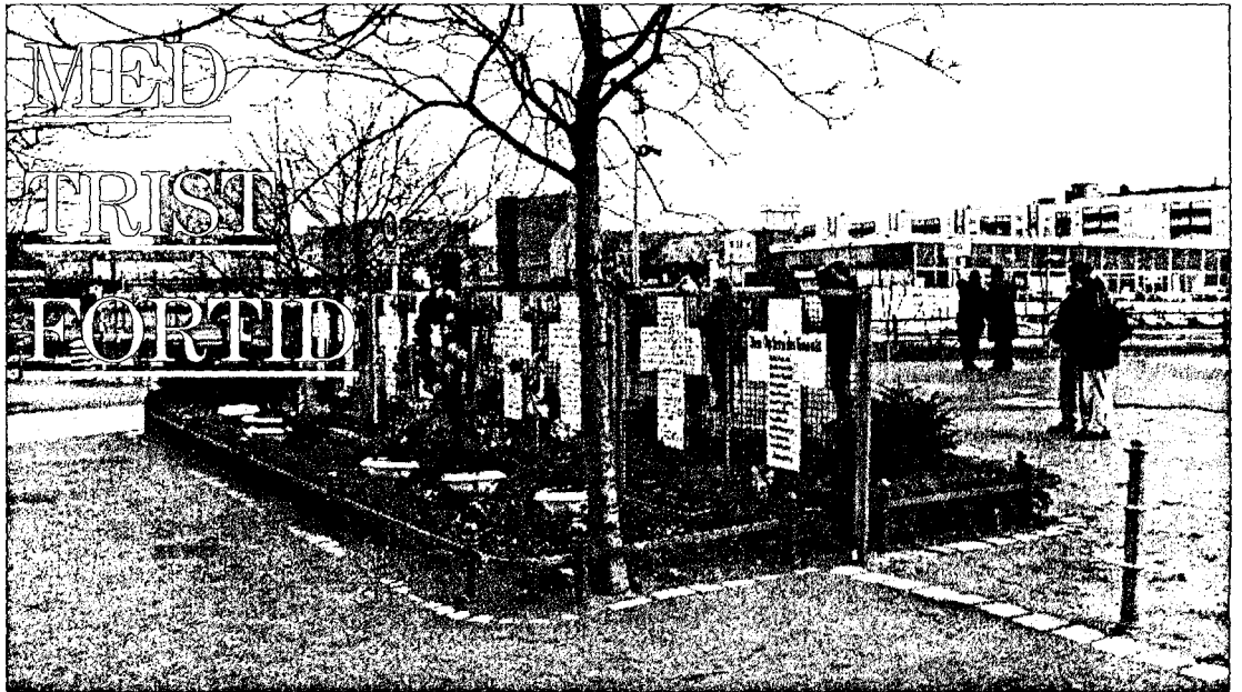
TRISTE MINNER: Seks hvite kors med navn på en rekke av murens ofre står ved Brandenburger Tor.

Ingen store endringer i temperaturene. Spesielle advarsler: Det er stor snøskredfare i vestlige fjellstrøk i Sør-Norge. Værvarsler som gjelder til imorgen kveld: Østlandet m/Oslo: Byget vestlig kuling utsatte steder, minkende til bris mot kvelden imorgen. Skiftende skydekke og for det meste oppholdsvær. Rondane, fjellstr. Dovre/Svenkegrensen og Trollheimen/Jotunheim en: Vestlig kuling som minker noe imorgen. Snø og snøbyger. Langfjella: Vestlig kuling, storm utsatte steder, noe minkende imorgen. Snø og snøbyger.