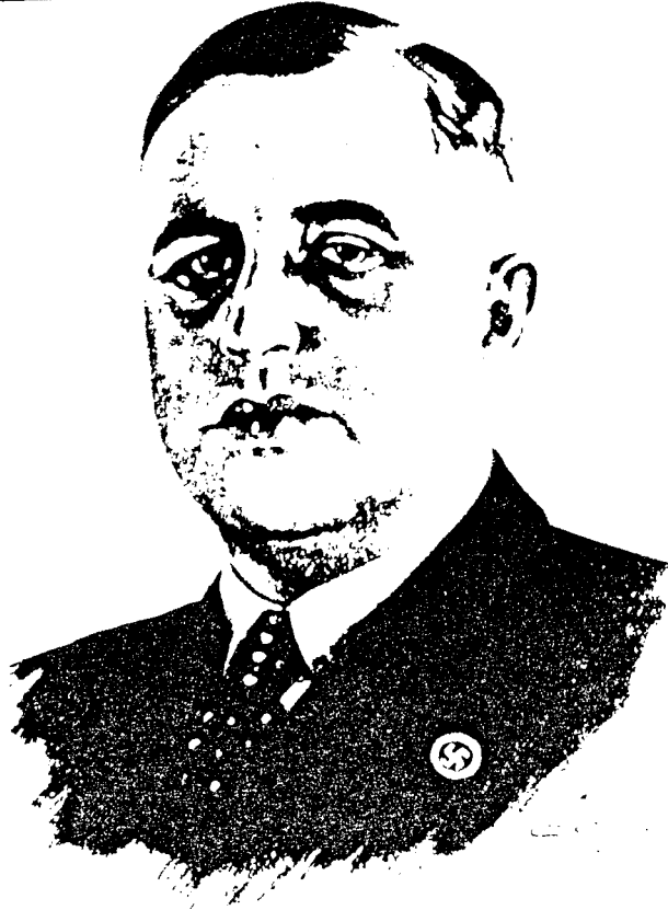
Frits Clausen 1893 - 1947