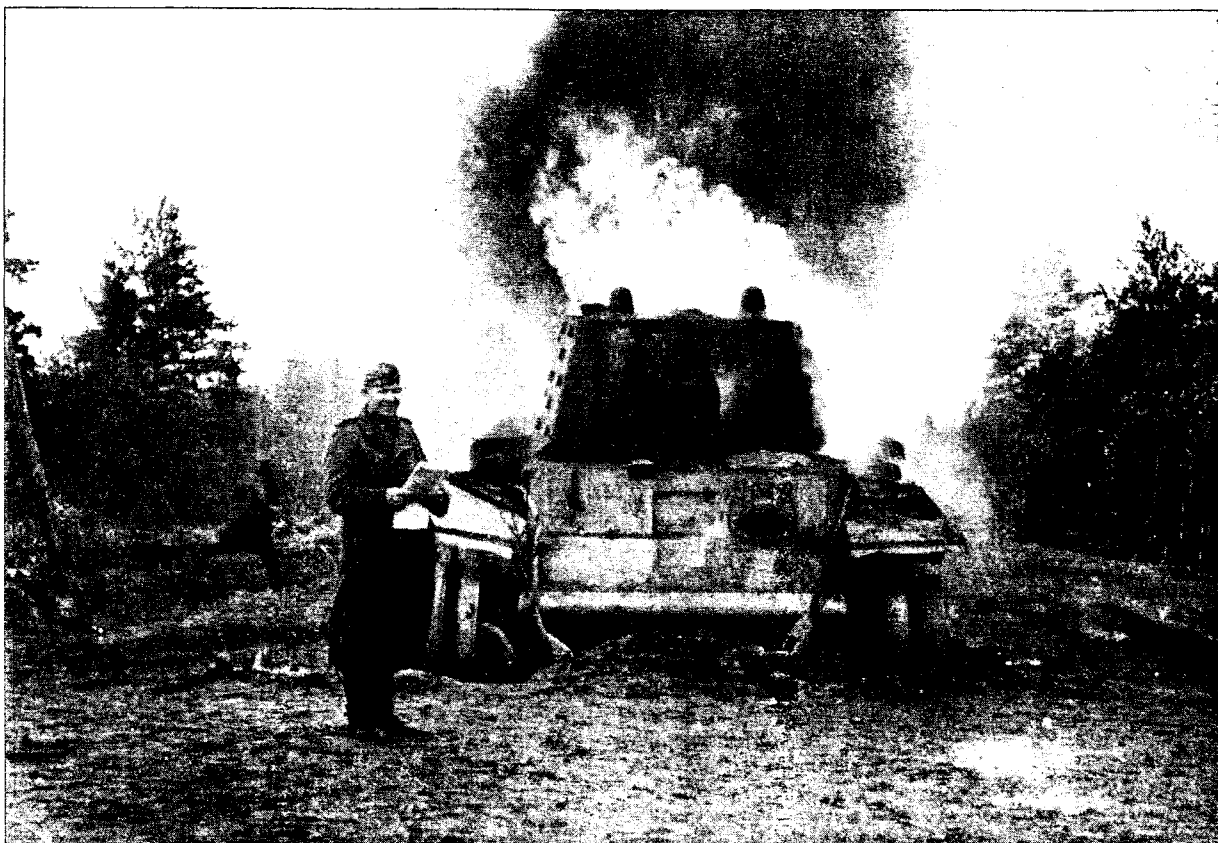
50 ÅR SIDEN: En finsk soldat smiler fornøyd ved siden av en brennende russisk stridsvogn i Karelen. Til å begynne med hadde finnene og deres norske kampefeller fremgang, men ved kampene rundt sankthans for 50 år siden møtte Den norske skijegerbataljon sin skjebne.

Vinterkrig 1939-40 skapte enorm sympati for finnenes kamp. Da finnene igjen var i kamp mot arveff-