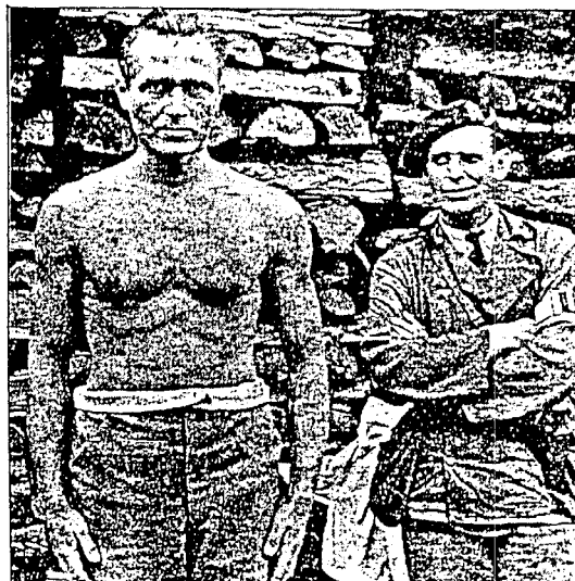
En av Norges mest forhatte menn - Gestapo-sjefen Slegfrid Fehmer - avledet for apell i fangegården.