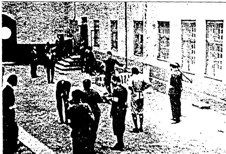
Et bilde viser hvordan norske Hjemmefrontmenn lar sin vrøds gå utover en norsk nazist. Personen midt i bildet med armbånd på venstre overarm trekker et NS-medlem ned i grusen.