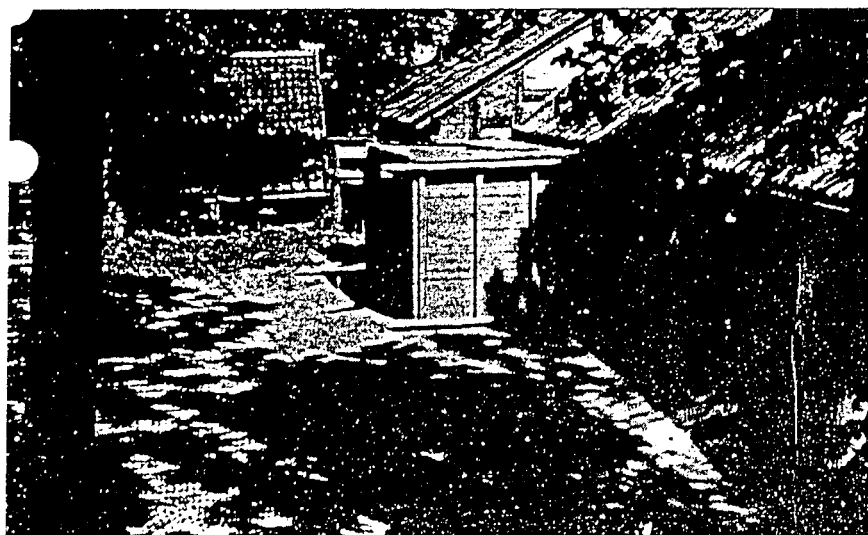
Avrettingskammeret - her ble de dødsdømte skutt klokken 04.00 om morgenen. En vegg i dette kammeret ble fjernet og eksekusjonspelotongen stilte opp.