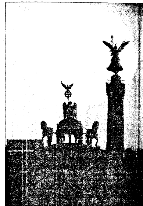
BERLIN-SYMBOLER: De germanske minnesmerker troner fortsatt over Brandenburger Tor.

Nok en gang er Berlin på vei til å bli forvandlet. Gjenforeningen sammen med nyopprettelsen av byen som hovedstad har ført til den største byggeorgie i dagens Europa. De gamle dodssoner og ingenmannsland skal fylles med den nye tids prosjekter. Store deler av bykjernen er blitt sammenhengende byggetomt, for forretningspalasser og andre rådyre anlegg. Langs Spree ved den gamle riksdagsbygningen skal et digert regjerings- og parlamentskvarter stige