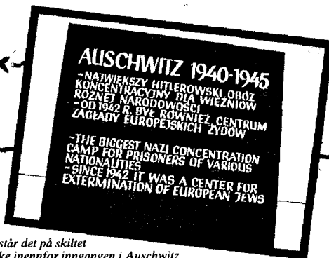
STØRST: «Den største nazi-konsentrasjonsleir for fanger fra forskjellige nasjoner. Siden 1942 et senter for utrydding av europeiske jøder», står det på skiltet like innfor inngangen i Auschwitz.