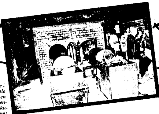
MATORIET: Ovnene i natoriet i Auschwitz ble ket for 50 år siden, men dem brenner små levende. Det som skjedde akkurat her vil aldri bli glemt.