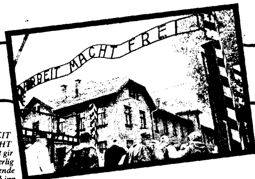
ARBEIT MACHT FREI: Det gir en underlig skremmende følelse å gå inn porten til KL Auschwitz.