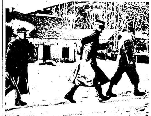
Konge og kronprins søker skjul for tysk fangenskap i Nybergsund.

Regjeringa si avgjerd var klar: Dei tyske krava måtte avvistas. Bräuer ringde Koht kl. 20 og fekk svaret. Kl. 23.30 gav sendemannen rapport til Berlin og si-terte den norske utanriksministeren: «Motstanden går vidare, så langt som mogleg.»