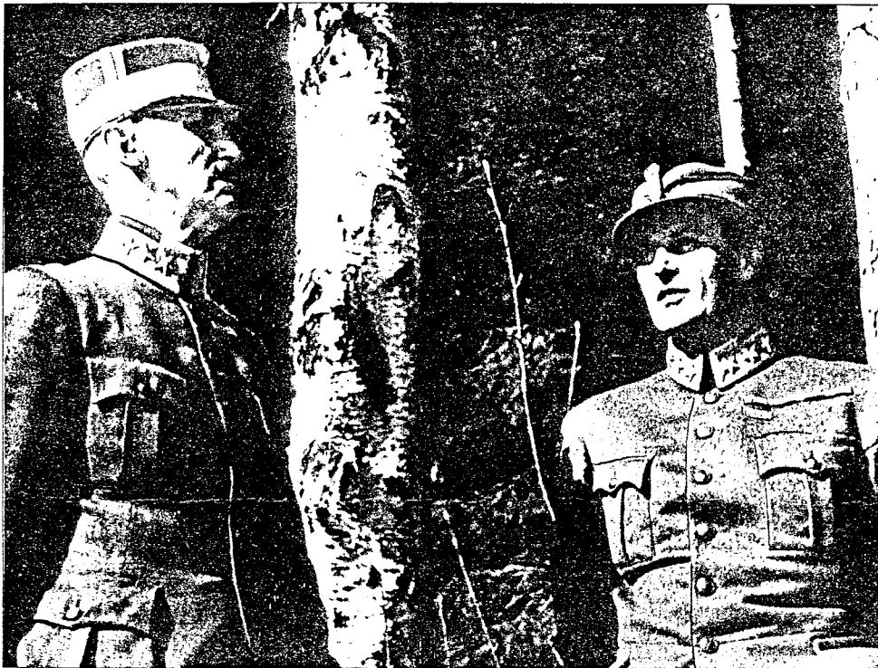
Kong Haakon og Kronprins Olav fotografert under krigen i Norge, i nærheten av Molde.

1945 • UTGITT AV KRIGSINVALIDEFORBUNDET OG VETERANORGANISASJONENE • 1985