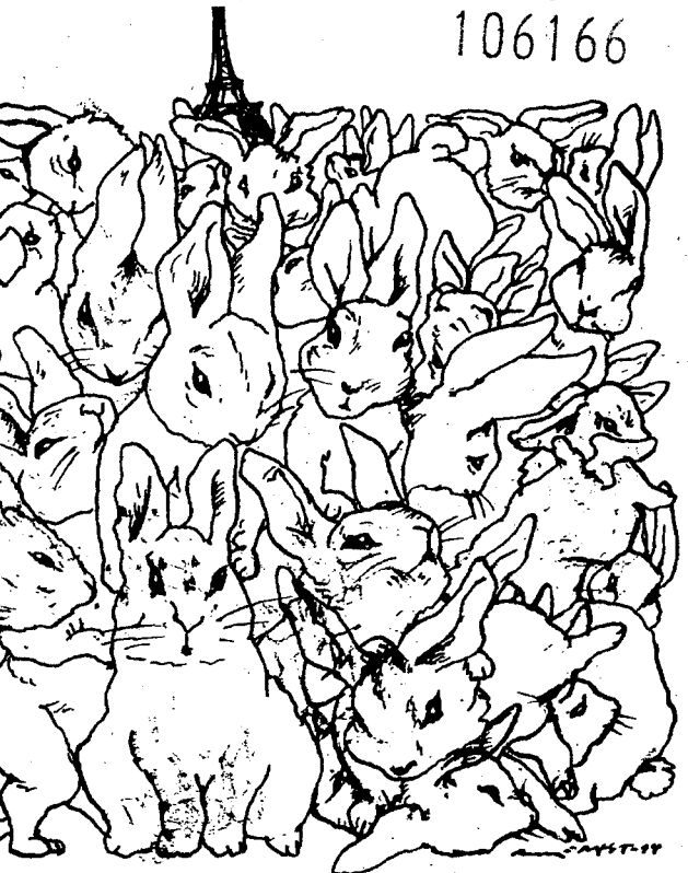
Tegning: ARNE NØST

Ingen ser så troskyldig ut som en beneiktende lommetyv. «Sette opp et