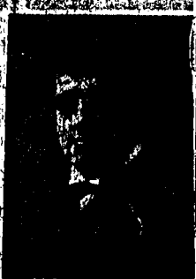
Direktør, professor Selv.