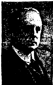
Høyesterettsjustitiarius Paal Berg som har tatt initiativet som overhode for den tredje statsmakt i regjeringen og Norges nye fravær.

Da tyske stridskrefter har besatt visse deler av Norge og derved har gjort det faktisk umulig for den norske regjering å opprettholde den administrative ledelse av disse landsdeler, og da det er tvungende nødvendig at den sivile administrasjon blir i gang, har Høyesterett funnet å måtte sørge for at det - for den tid disse landsdeler er okkupert av tyske stridskrefter - opprettes for de besatte områdene et administrasjonsråd til å lede den sivile administrasjon.