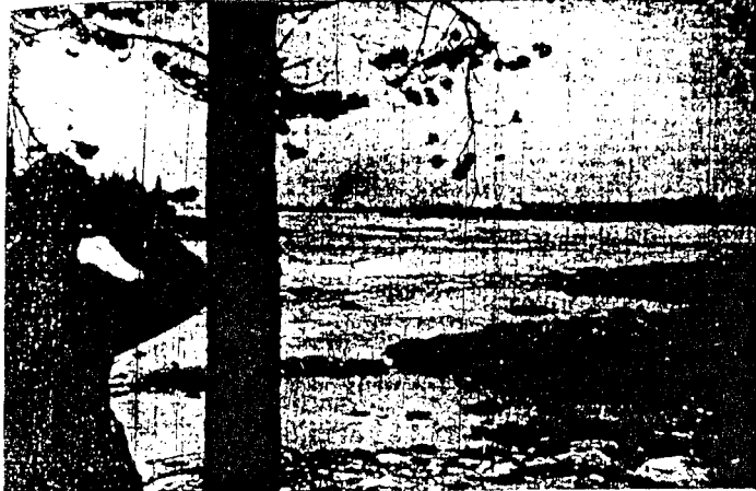
Rykemän komentaja tarkkailee saksalaisten liikkeitä palovassa Muoniossa. — Tikkava