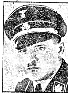
Sepp Dietrich, General der Waffen-SS und Kommandeur der „Leibstandarte Adolf Hitler“, wird heute 52 Jahre alt. Er hat der Partei alles zu verdanken, eine märchenhafte Karriere, ein Schloss in Saarow bei Berlin und ein anderes in St. Quirin am Tegernsee.

Kiels Kriegsmarine gewann einen Tenniskampf gegen Schleswig-Holstein und trägt im Juni Städtekämpfe gegen Bromön und Hamburg aus.