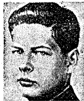
Unge kung Mikael framstår i dag som en "stark man".