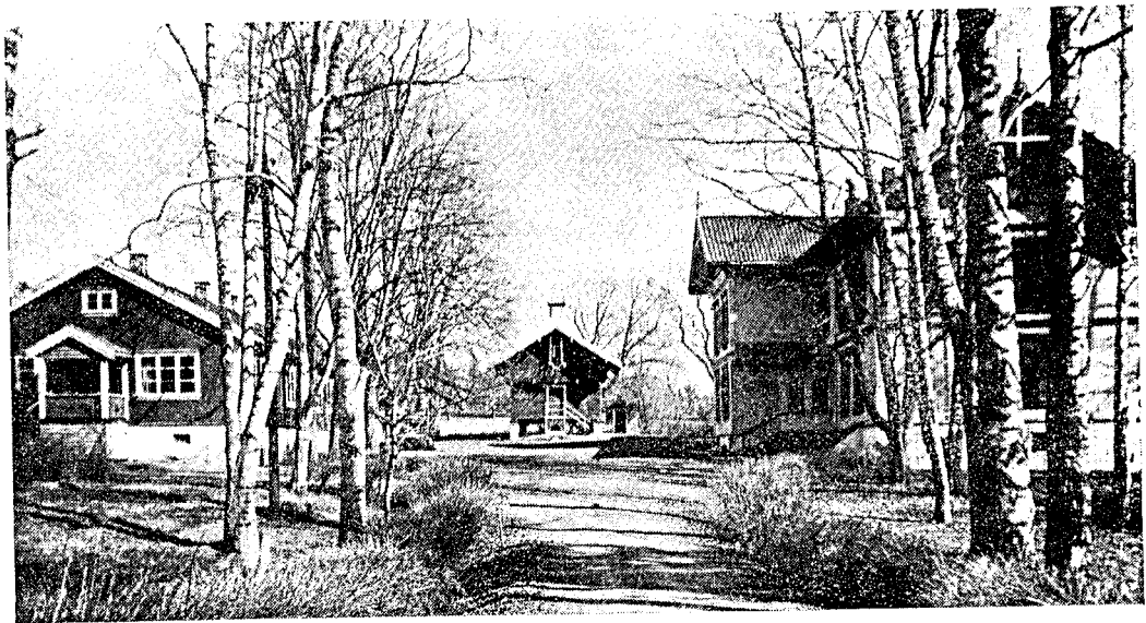
Frå tunet til Nasjonalhøgskulen.

På Holtet gard like ved Stabekk st., 9 km frå Oslo, har Noregs Ungdomslag sin høgskule.