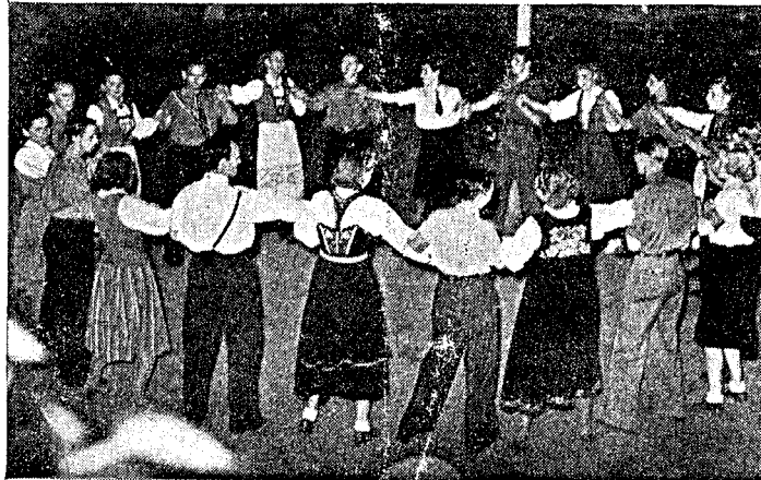
Frå leikaringen på Nasjonalhøgskulen.

Ungdomen vil no meir enn nokon gong før få høve til å vera med å byggja landet både materielt og kulturelt. Eit skeid på Nasjonalhøgskulen vil gjeva deg syn for det store verd som vår nasjonale folkekultur har. Her møter du vaken ungdom frå heile landet. Her vinn du vener for heile livet.