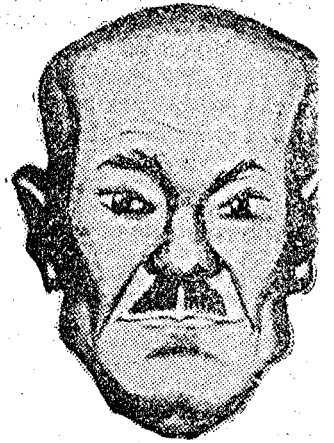
Major Attlee. Engelsk karrikatur

er gammel. Han er sønn av en advokat i London og tok en glimret eksamen i Oxford. Etterpå bestemte han sig til å følge farens fotspor og han etablerte sig som advokat i hovedstaden. Dette var omkring 1905, dengang Joe Chamberlain steg på høiden av sin innflytelse. D