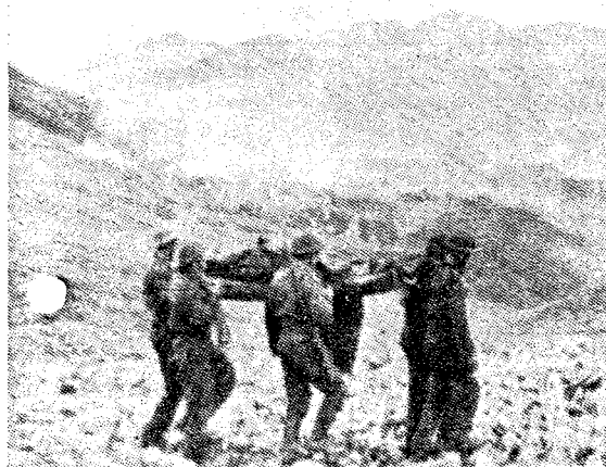
Fem norske soldater bærer en såret kollega i sikkerhet. I bakgrunnen de rykende ruiner av Barentsburg. Illustrasjon fra Eystein Fjærli's bok «Krigens Svalbard».

Eystein Fjærli: KRIGENS SVALBARD Gyldendal norsk forlag.