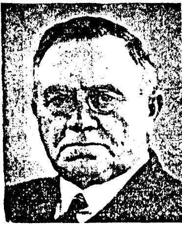
Kongen, Kronprinsen og regjeringen Nygaardsvold fortalte videre nordover, og drø senere til Storbritannia, hvorfra de i årene som fulgte, ledet Norges frigjøringskamp.