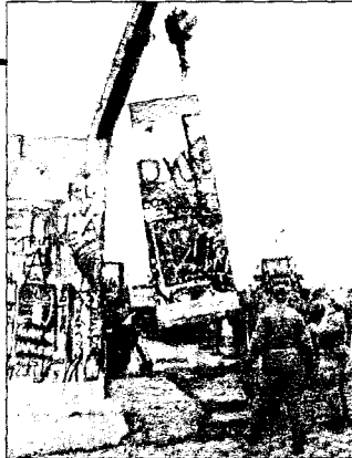
DEMONTERES: En seksjon av Muren fjernes for å gi plass til grenseovergang ved Potsdamer Platz.

FORSVUNNET: Hvor ble det av Muren? spør turistene i Berlin. Bare noen få og bortgjemte biter er tilbake av betongveggen som i 28 år var symbolet på Tysklands og Europas deling. Lengre tid vil det ta å demontere «den mentale mur» som ennå lever videre i de fleste tyskers hoder.