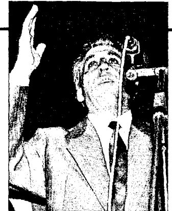
FORTIDEN: Egon Krenz, DDRs statssjef da Muren falt, vil gjerne bidra til en «objektiv historieskrivning».

TAPEREN: Tiden er inne for forsoning mellom østtyskere og vesttyskere, mener den tidligere stats- og partisjefen Egon Krenz, som har skrevet brev til forbundskansler Helmut Kohl. Krenz er arbeidsløs og politisk venneløs. – Men jeg beveger meg fritt på gaten. Heldigvis, forsikrer han Aftenposten.