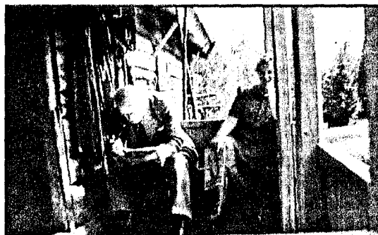
SETERBESØK: Knut og Marie Hamsun på Nupen-setra i Elverum i 1939.