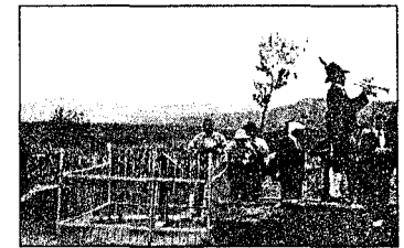
Das Grab des unbekanntem Soldaten neben dem Ehrenmal und ein Trompeter aus Tirol.