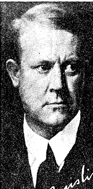
generasjon spør seg om ikke en figur som Vidkun Quisling (i midten) og hans parti også må underlegges «objektive» forskningskriterier.