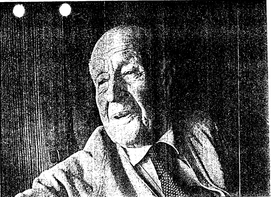
Sverre Parelus Riisnæs, justisminister under Quisling-regjeringen, bodde nærmere 20 år i Hof-Asa i Solør. En kynisk stor-nazist — eller en ganske alminnelig solung? Eller begge deler? Søndag og mandag hadde NRK-Radio satt opp intervjuer med Riisnæs, som døde i fjor, der han forteller om hittil ukjente dramatiske i krigens sluttfase. Nå har familien nektet offentliggjøre de intervjuene.

15 år senere — han hadde gått 13 år gården med planting, bær- og plukkning og omne-arbeid, og han holdt seg i meget