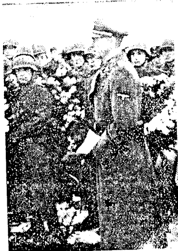
¶ Oberführer Fehlis tæter.

(NTB) Gården Snøan i Støren i Trøndelag ble herjet av brann i kveld. Ilden oppstod på låven og brente seg med rivende fart. Uthuset brant ned i løpet av kort tid, men heldigvis lyktes det å redde husdyrene, bl. a. åtte kuer og to hester. Ilden forplantet seg til hovedbygningen, men hjelpemannskapene klarte å slokke før større skader var gjort. Ved 23-tiden i kveld var brannen sløkket. Det var ingen mennesker på låven i hele dag og årsaken er temmelig gåtefull.